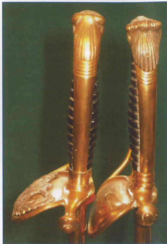
Afb. 3 Leeuwenmanen van een (vroeg) muzikantendegen (links) en een meesterdegen (col. G.R. Hof)