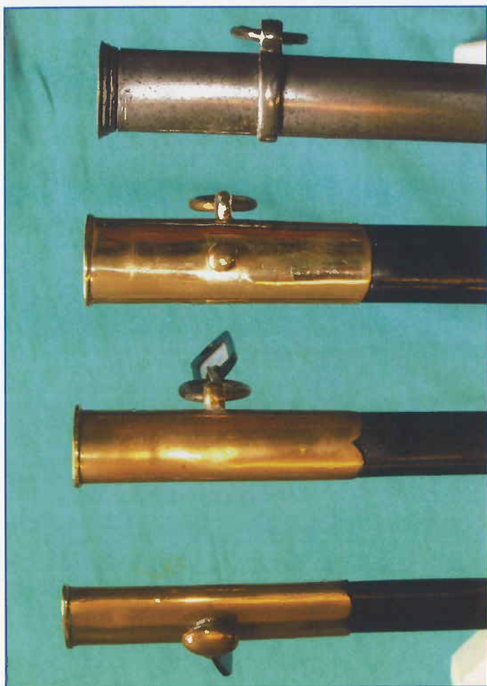
Afb. 2 De diverse draagwijzen der meesterdegen, v.o.n.b. met knop (= van model), met oog en ring, met knop, oog en ring, met 2 ogen en ringen aan stalen schede (col. G.R. Hof)