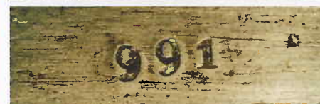
6A en 6B. Nederlandse wapennummers op het middenijzer ("het lijf") van Frans-Nederlandse enterbijlen