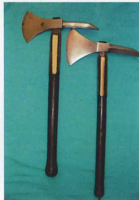
5. Frans-Nederlandse enterbijlen (collectie G.R. Hof)