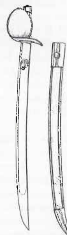
2. Franse entersabel M. An 11 (uit Pétard 2006)

In de oorspronkelijke uitvoering had dit wapen een langere kling (75 cm), bij een breedte op de ricasso van 3,9 cm en een kromming van 2 cm. Deze sabels waren alle voorzien van een op beide zijden van de kling gegraveerd anker echter, al vóór 1804 werden de kling ingekort tot ongeveer 67 cm.