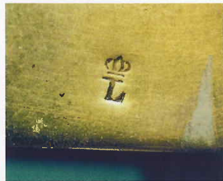
3. Nederlands controleurstempel op de haakband van een Franse entersabel Model An 11 met rugschrift Mfture Imple du Klingenthal mai 1812 (collectie E. van Veen)

Met dank aan Mevr. E. Sint Nicolaas voor nadere informatie over de sabel van van Speijk en de andere marinewapens in het Rijksmuseum