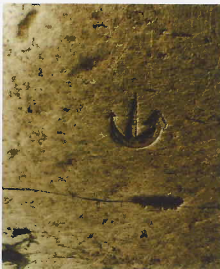
1. Frans Marine-acceptatie ankertje op entersabel en enterbijl

Op de rug gemerkt: Mfcture de Klingenthal Coulaux Frères Entreprs. Klinglengte 65 cm, klingbreedte op de ricasso 5,1 cm en een kromming (pijlhoogte) van 2,3 cm. Meestal met een klein ankertje, het acceptatiemerk van de Franse marine, op de ricasso (zie afb. 1); slechts zelden met een gegraveerd anker op de kling (schuin of recht). Dit model is uiterst zeldzaam, zelfs in die mate dat in de literatuur geen afbeelding van een schede te vinden is.