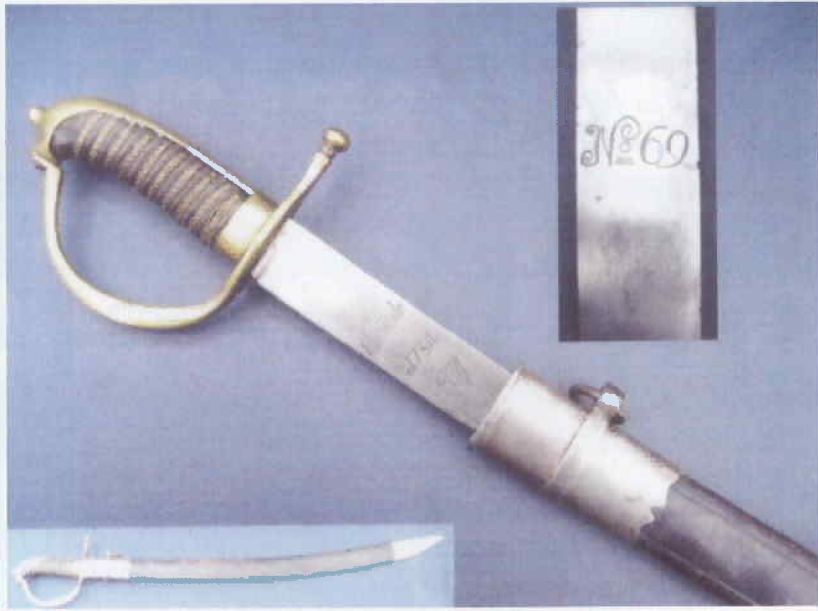
Afb.11 Noodsabel: oorspronkelijk Vrijcorpssabel Enschede, ont- daan van twee zijbeugels na 1813, gestoken in veel latere (politie-) schede