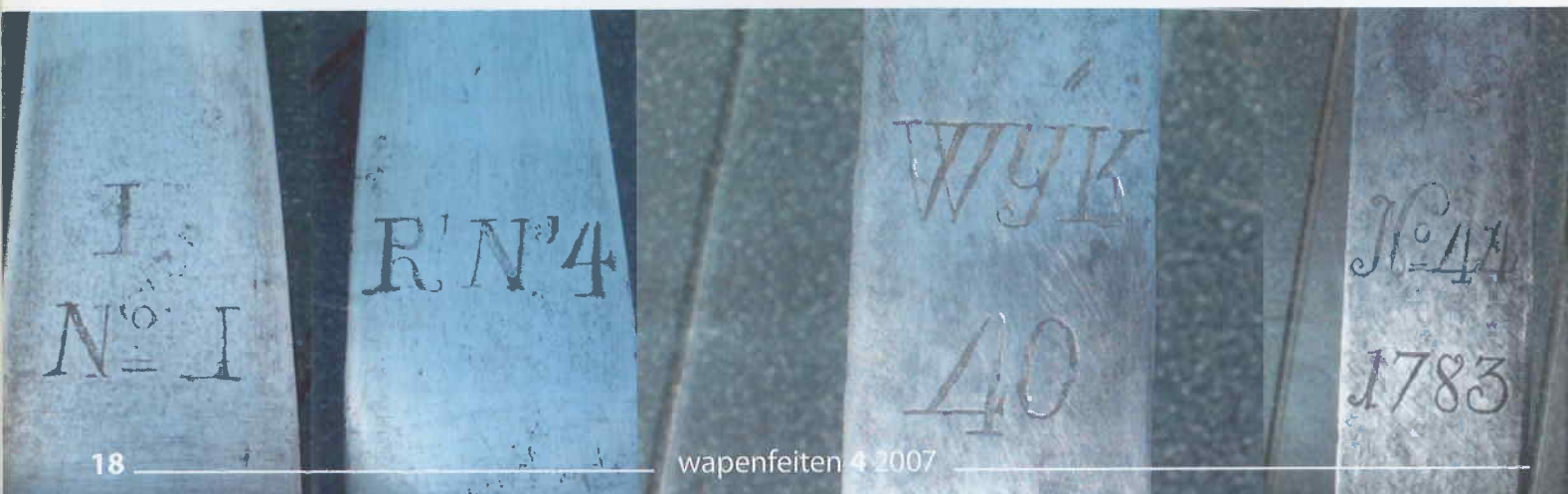
Afb.6 en 7 Klingopschriften Vrijcorpssabel Amsterdam (afb.4)