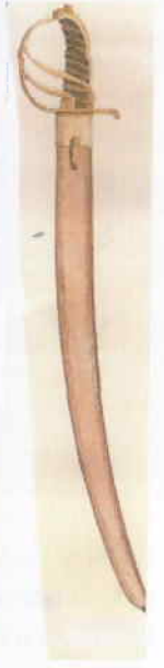
Afb.1 Algemeen model van eind-achttiende-eeuwse infanterie sabel

overstuurde om één en ander recht te zetten. Ik ervaar het nog altijd als onverklaarbaar dat het patriotische verzet, dat toch gestoeld was op een doorleefd stuk idealisme en zelfs ondersteund werd door een mobiele eenheid ("Mappa's leger-tje"), als sneeuw voor de zon verdween voor het Pruisische leger.