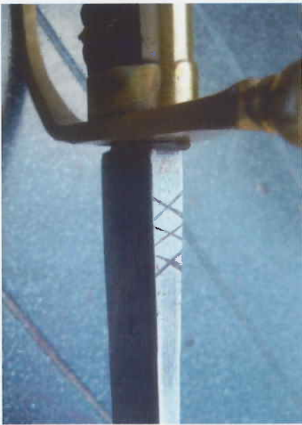
Afb. 9 Klingrug Schutterijsabel Amsterdam