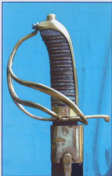
Afb.4 Vrijkorpssabel Amsterdam (collectie G.R. Hof)

Tegen het eind van de 18e eeuw waren er twee vormen van militie. In de eerste plaats waren er de Schutterijen, famous wegens hun rol tijdens de Tachtigjarige Oorlog. Deze Schutterijen waren echter in de loop van de 18e eeuw ernstig in verval geraakt. Vooral door algemeen en zeer uitgebreid regenten-nepotisme hadden de Schutterijen meer tot doel het verlenen van status aan de regentenfamilies, waarvoor zij een dankbare sinecure waren. Het gevolg was dat de bewapening ernstig was verwaarloosd en niet veel verder kwam dan het "hooivorken-niveau". Bekend is de klacht van een Rotterdammer in 1780 dat de gewoonte de nieuwe kapiteins met drie geweesalvo's te begroeten was afgeschaft omdat de snaphanen in een veel te erbarmelijke staat verkeerden. "Zieltogend" is het goede woord voor de Schutterijen der 18e eeuw. De Schutterijen, voortgekomen uit de 12e en 13e eeuwse stadswachten, hadden wortels in de gilden en als zodanig waren ze zeer gesloten en besloten; een katholiek of baptist had geen kans toegelaten te worden. Dan waren er de burgercompagnieën, die meer verbonden waren aan de plaatselijke (vaak Oranjegezinde) magistratuur.