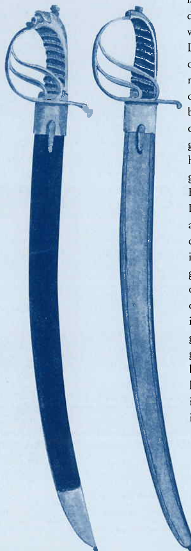
Afb. 2. Infanteriesabel M.1809 ("Stralsundsabel")