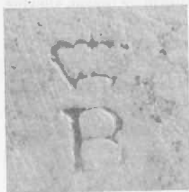
Afbeelding 1: Stempel van E.B. Brossois op ricasso Marchessee-klewang M.1913.

In deze periode vonden nog enkele andere wijzigingen plaats. De controleurs werden betrokken bij de keuring van voorwerpen anders dan wapens in strikte zin. Zo werden bijvoorbeeld in 1901 voor het Ministerie van Marine een aantal schiet-(=slacht) maskers gekeurd. Ook instrumenten, gebruikt bij de aanmaak van wapens aan de Hembrug, werden bij aankoop door wapencontroleurs gekeurd. Een andere ontwikkeling was, dat bij het uitzenden van een keuringscommissie niet meer in alle gevallen, zoals tot dan gebruikelijk was, één of meerdere werklieden/controleurs werden uitgezonden onder bevel van een officier der artillerie, maar dat nu ook officieren alleen de keuring voor hun rekening namen; zo ging de Luitenant van Dam op 27-2-1905 naar Berlijn voor de keuring van een partij Parabellum-Lugers (brief Ministerie van Oorlog 29-12-1904 IVe afd. No.81), een kapitein G.Th. van Dam (dezelfde?) naar Steyr in 1910 voor de keuring van een partij mitrailleurs (KB 19-1-1910 No.32) en een Luitenant Donker in 1905 naar Steyr, voor de keuring van een aantal veldmitrailleurs systeem Schwarzloze, aangemaakt bij de Oesterreichische Waffen Ges.