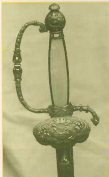
Afb. 2 Degen Ingenieur Rijkswaterstaat