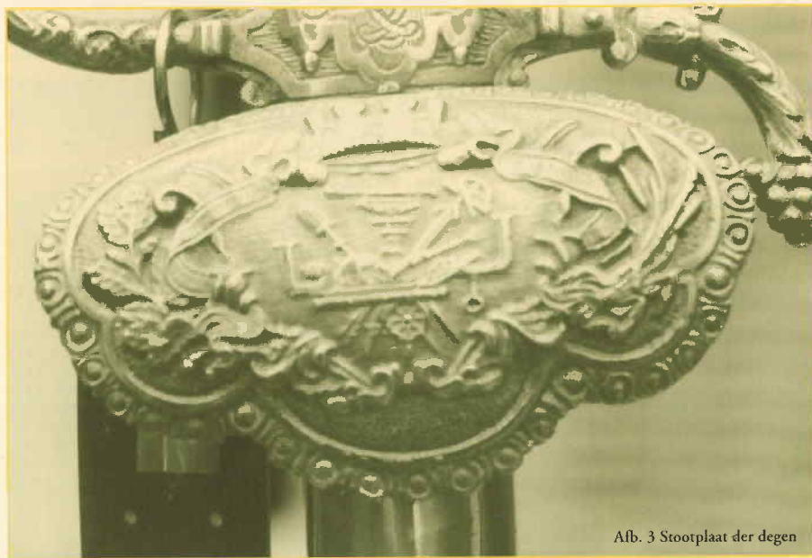
Afb. 3 Stootplaat der degen