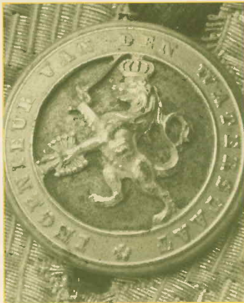
Afb. 4 Knoop van het tenue van Ingenieur Rijkswaterstaat