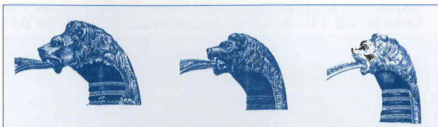
Afb. 2 (Parderkopfsabel)