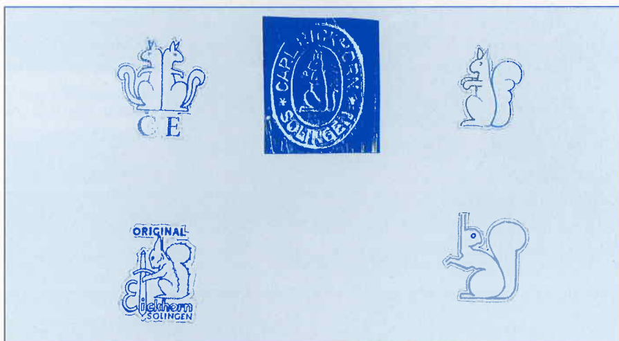
Merken van Carl Eickhorn

lijkt om de angel op de kap om te smeden en dan te ciselieren; de gepatenteerde wijze (Deutsches Reichs Patent 645578) van Eickhorn voorkwam het losraken van de angel op de greepkap.